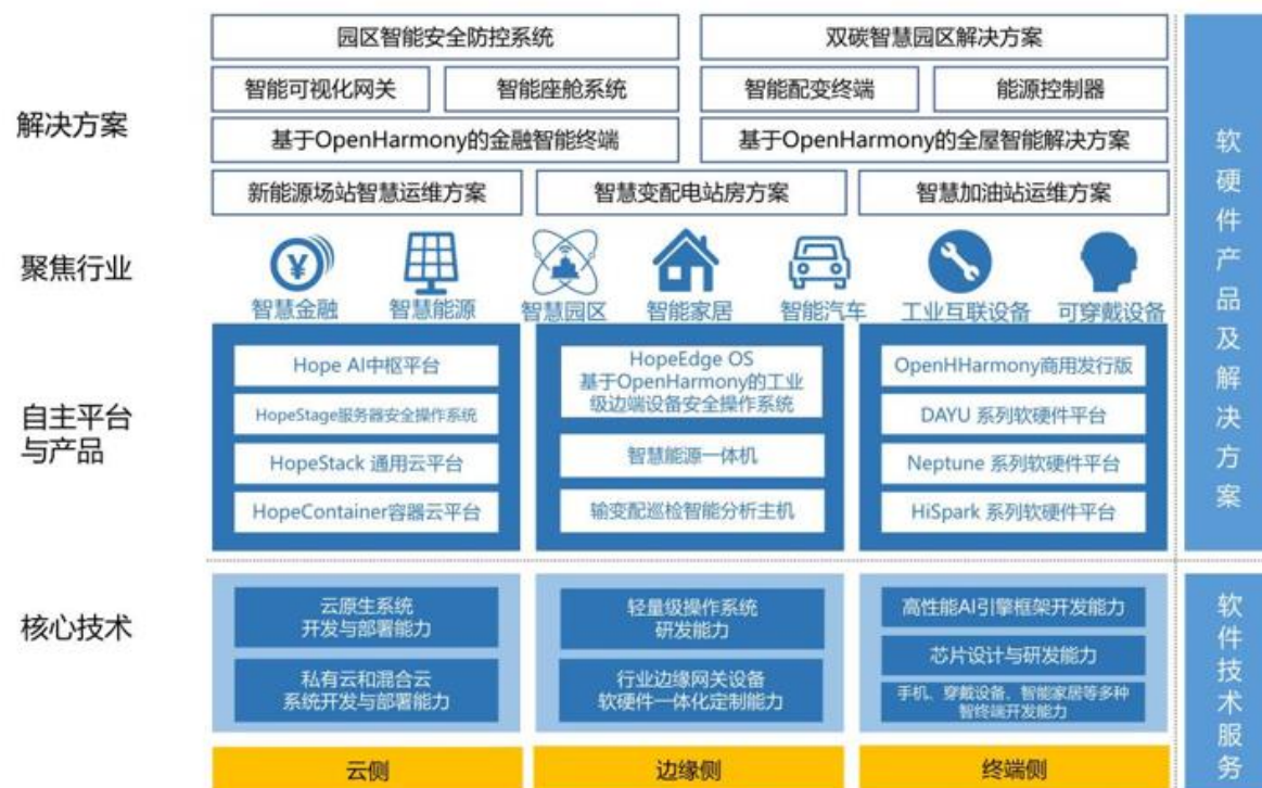
润和软件智能物联业务架构图