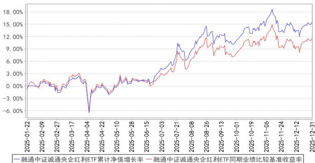
融通中证诚通央企红利ETF累计净值增长率与同期业绩比较基准收益率的历史走势对比图

注：1、本基金基金合同生效日为 2025 年 1 月 22 日，至报告期末合同生效未满 1 年。