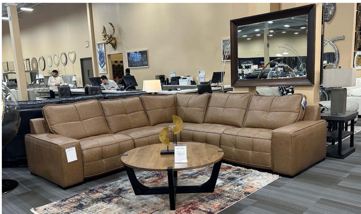
MOTOMOTION FASHION-FORWARD-FURNITURE 当地时间2024年2月28日在客户的家具零售店拍摄的匠心产品

2023 年 3 月，美国家具行业的优秀设计师 Jackson Carpenter 正式加盟匠心并随后开发出设计独特、功能创新、用材更好、色彩更为丰富的 MotoLiving 系列沙发。截至 2024 年 3 月底，公司共收到 MotoLiving 来自 45 个客户的上千万美金订单。MotoLiving 的产品最早从 2023 年 8 月底开始出货，于当年的 10 月底、11 月初陆续进入零售商店而面向消