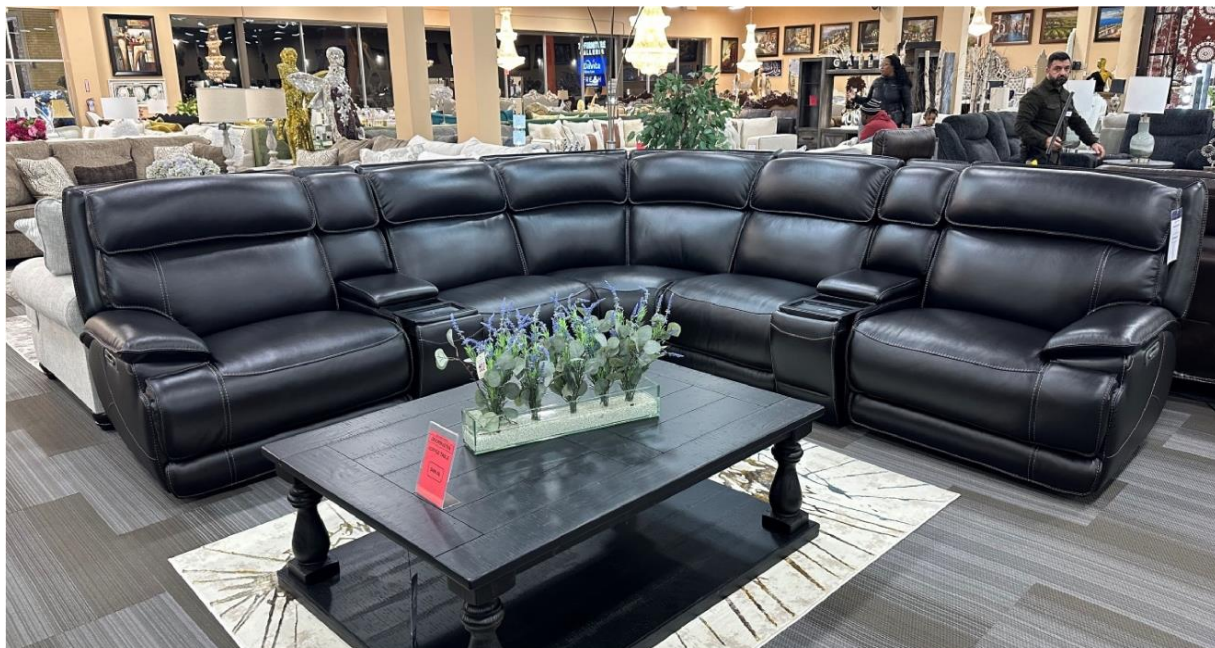
MOTOMOTION FASHION-FORWARD-FURNITURE 当地时间2024年2月28日在客户的家具零售店拍摄的匠心产品

公司主要从事智能电动沙发、智能电动床及其核心配件的研究、设计、开发、生产、销售及服务。根据中国证监会《上市公司行业分类指引》（2017 年修订），公司所处行业为“C21 家具制造业”中的“C2190 其他家具制造”。