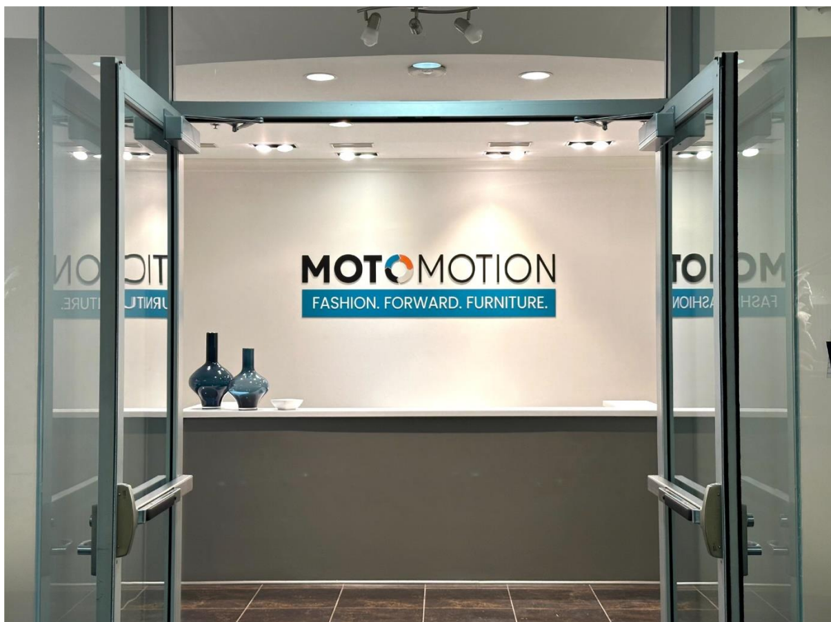
MOTOMOTION FASHION-FORWARD-FURNITURE 当地时间2024年1月24日在匠心美国的拉斯展厅拍摄的接待区

2023 年的两次拉斯维加斯（简称拉斯）展会（1 月和 7 月）之后，公司就开始规划扩大在拉斯的展厅。2015 年 7 月，公司开辟美国市场的第一步就是从拉斯一个面积只有 500 平米的展厅开始的。由于当时的展厅和业内一家大公司的展厅在同一个楼层，我们经常会被误认为是该公司的一部分。