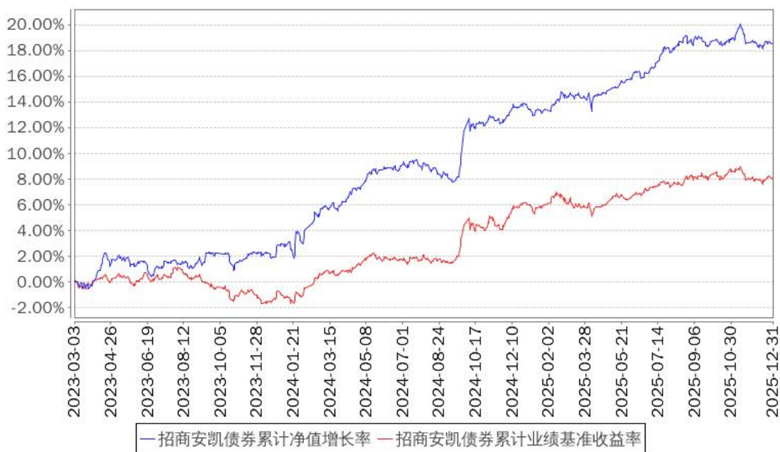
招商安凯债券累计净值增长率与同期业绩比较基准收益率的历史走势对比图