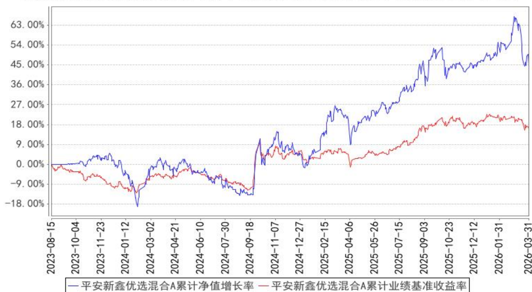
平安新鑫优选混合A累计净值增长率与同期业绩比较基准收益率的历史走势对比图