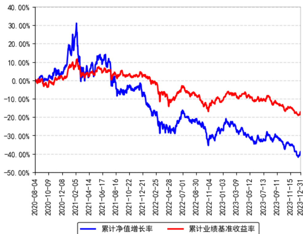
南方景气驱动混合A累计净值增长率与同期业绩比较基准收益率的历史走势对比图