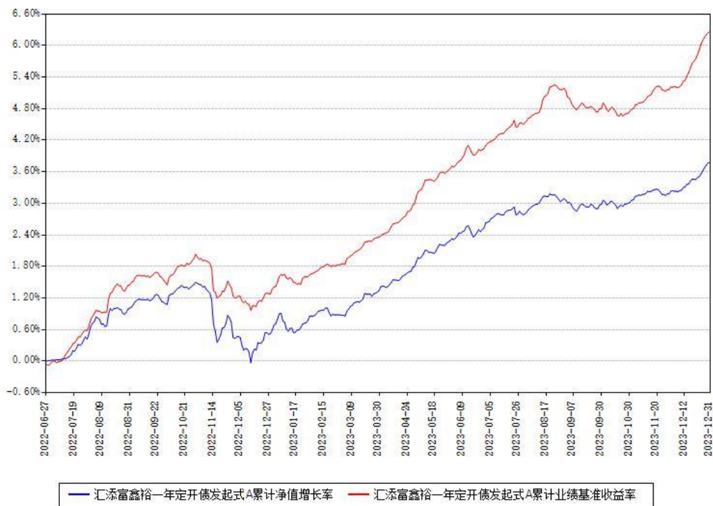
汇添富鑫裕一年定开债发起式A累计净值增长率与同期业绩基准收益率对比图

注：本基金建仓期为本《基金合同》生效之日（2022年06月27日）起6个月，建仓期结束时各项资产配置比例符合合同约定。