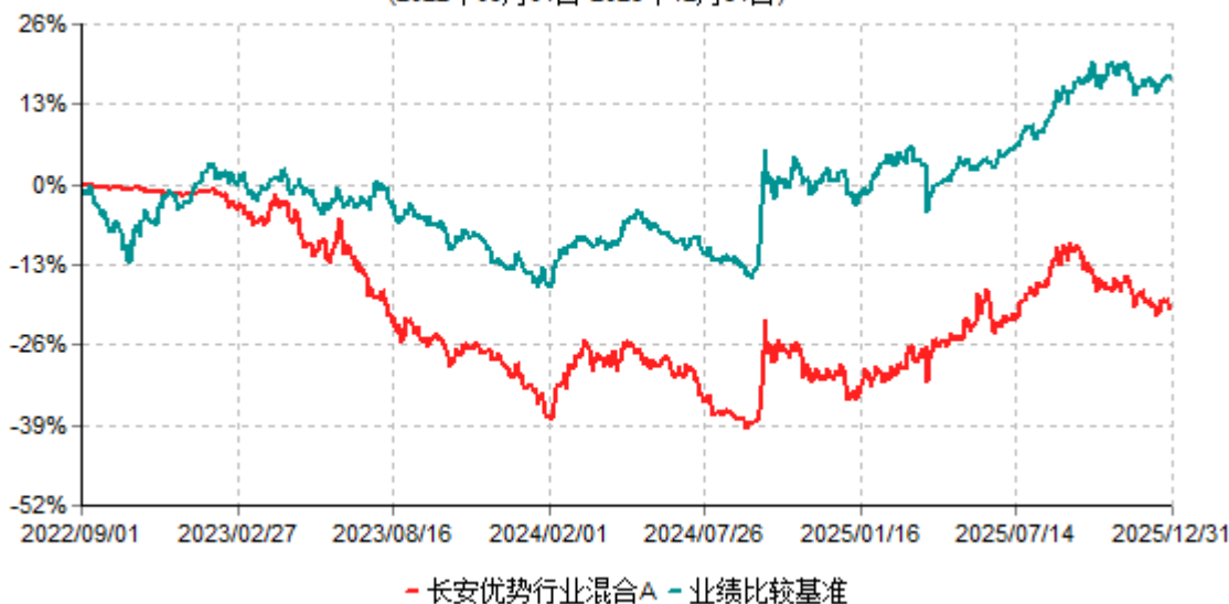
长安优势行业混合A累计净值增长率与业绩比较基准收益率历史走势对比图 (2022年09月01日-2025年12月31日)

根据基金合同的规定,自基金合同生效之日起6个月内基金各项资产配置比例需符合基金合同要求。本基金在建仓期结束后,各项资产配置比例已符合基金合同有关投资比例的