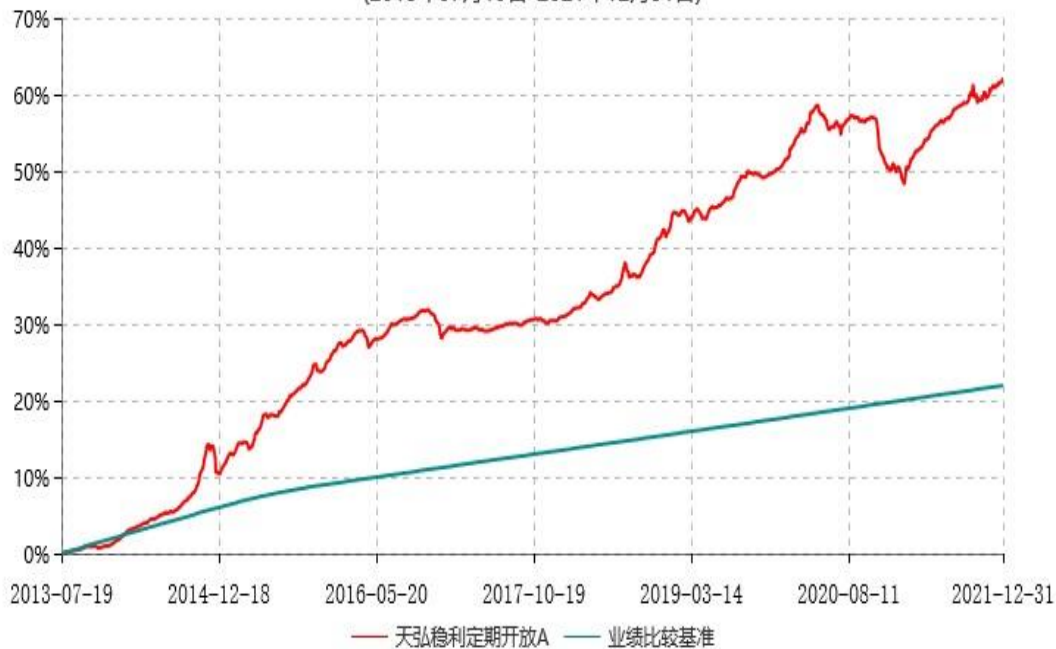
天弘稳利定期开放A累计净值增长率与业绩比较基准收益率历史走势对比图 (2013年07月19日-2021年12月31日)