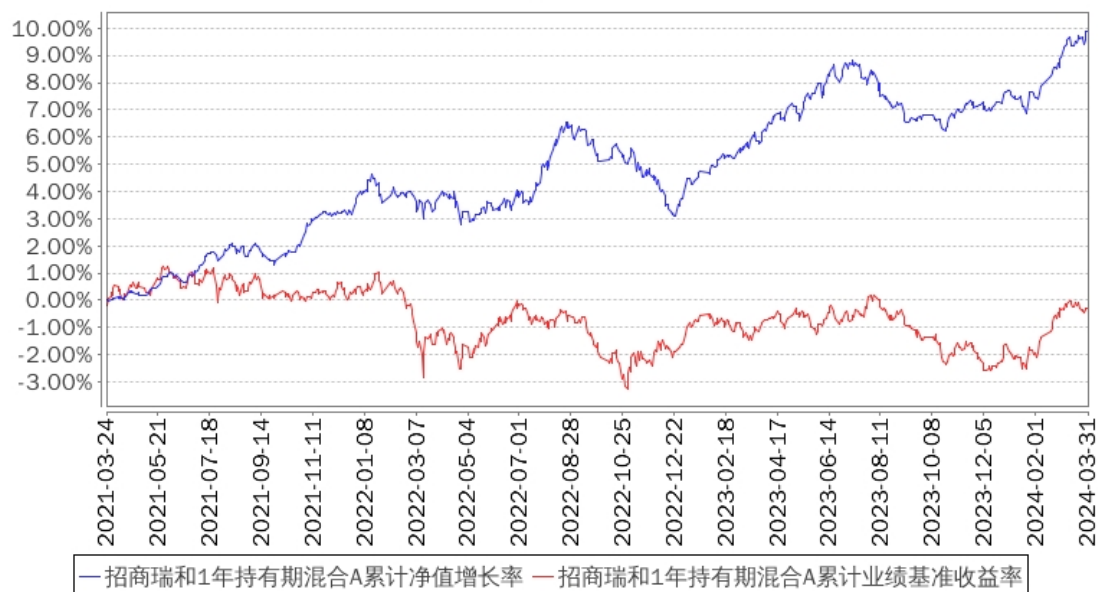
招商瑞和1年持有期混合A累计净值增长率与同期业绩比较基准收益率的历史走势对比图