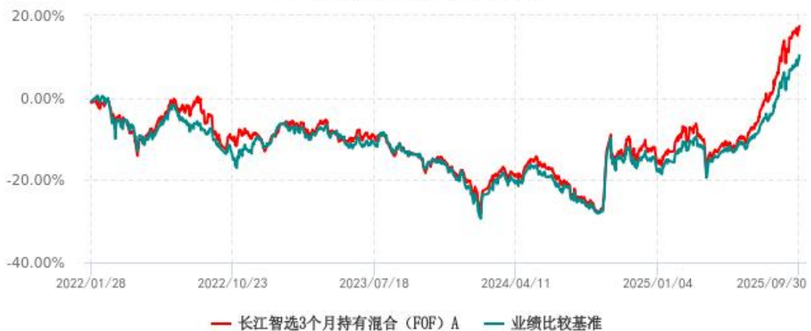
长江智选3个月持有混合（FOF）A累计净值增长率与业绩比较基准收益率历史走势对比图 (2022年01月28日-2025年09月30日)

注：（1）本基金的业绩比较基准自2023年11月17日起由“沪深300指数收益率*70%+中债-综合全价（总值）指数收益率*30%”变更为“中证金选偏股基金策略指数收益率*90%+中债-综合全价（总值）指数收益率*10%”；（2）本基金A类份额“自基金合同生效以来”的报告期为2022年01月28日至2025年9月30日。