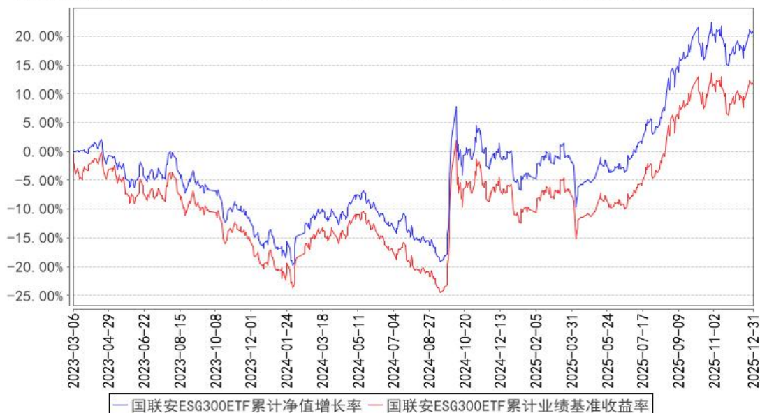
国联安ESG300ETF累计净值增长率与同期业绩比较基准收益率的历史走势对比图