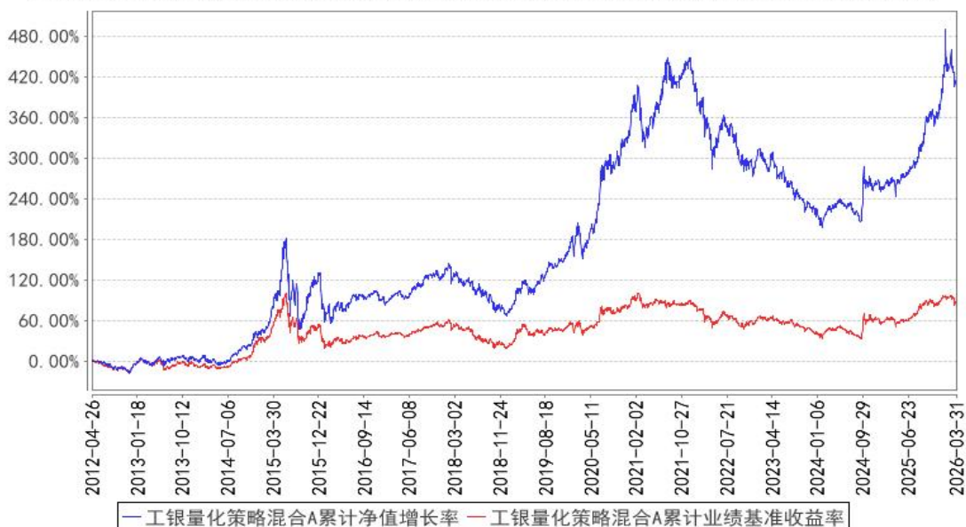
工银量化策略混合A累计净值增长率与同期业绩比较基准收益率的历史走势对比图