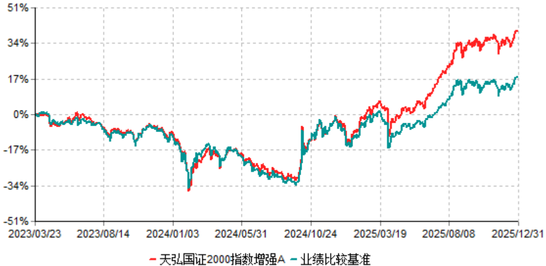
天弘国证2000指数增强A累计净值增长率与业绩比较基准收益率历史走势对比图 (2023年03月23日-2025年12月31日)