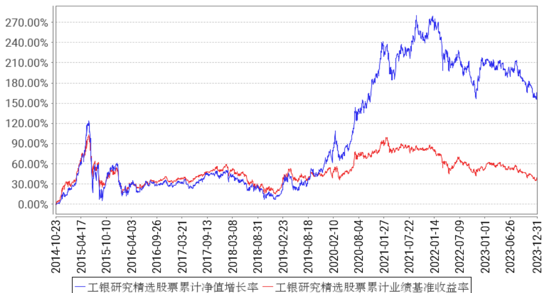
工银研究精选股票累计净值增长率与同期业绩比较基准收益率的历史走势对比图