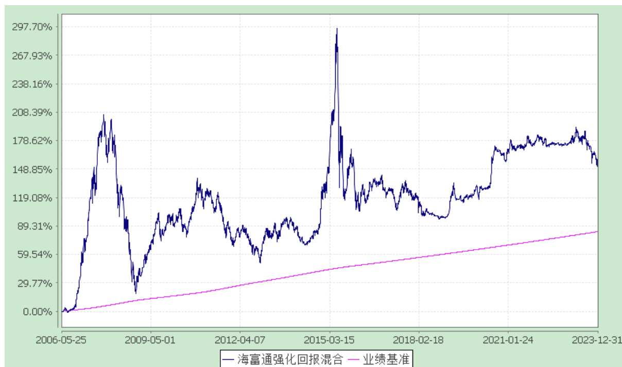
海富通强化回报混合型证券投资基金 份额累计净值增长率与业绩比较基准收益率的历史走势对比图 (2006年5月25日至2023年12月31日)

注：按照本基金合同规定,本基金建仓期为基金合同生效之日起六个月。建仓期满至今,本基金投资组合均达到本基金合同第十二条(二)、(七)规定的比例限制及本基金投资组合的比例范围。