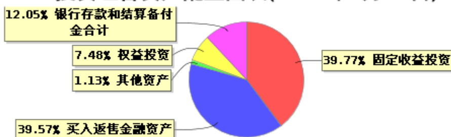
投资组合资产配置图表(2024年6月30日)

● 固定收益投资 ● 买入返售金融资产 ● 其他资产 ● 权益投资 ● 银行存款和结算备付金合计