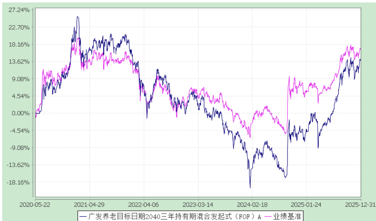
广发养老目标日期 2040 三年持有期混合发起式（FOF）Y