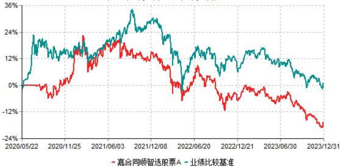
嘉合同顺智选股票A累计净值增长率与业绩比较基准收益率历史走势对比图 (2020年05月22日-2023年12月31日)