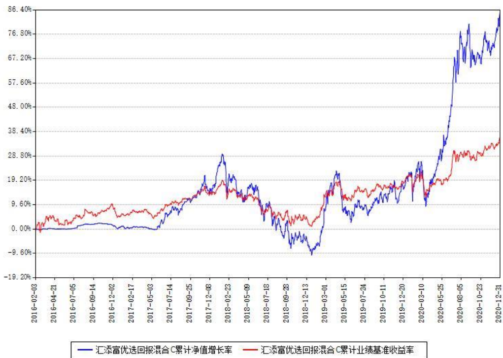
汇添富优选回报混合C累计净值增长率与同期业绩基准收益率对比图