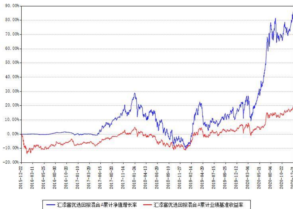
汇添富优选回报混合A累计净值增长率与同期业绩基准收益率对比图