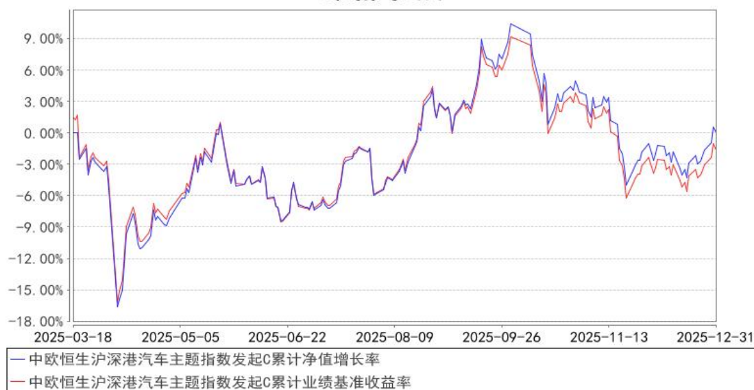
中欧恒生沪深港汽车主题指数发起C累计净值增长率与同期业绩比较基准收益率的历史走势对比图

注：本基金基金合同生效日期为 2025 年 3 月 18 日，自基金合同生效日起到本报告期末不满一年，