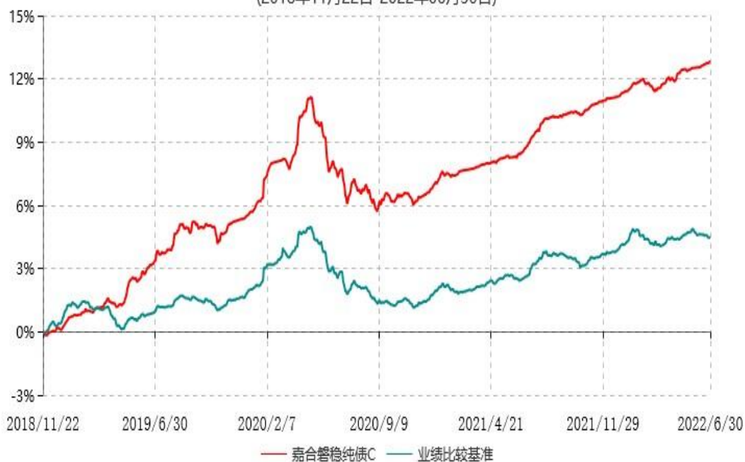
嘉合磐稳纯债C累计净值增长率与业绩比较基准收益率历史走势对比图 (2018年11月22日-2022年06月30日)