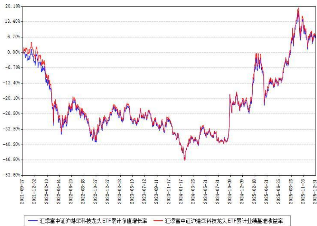
汇添富中证沪港深科技龙头ETF累计净值增长率与同期业绩比较基准收益率对比图

注：本基金建仓期为本《基金合同》生效之日（2021年09月27日）起6个月，建仓期结束时各项资产配置比例符合合同约定。