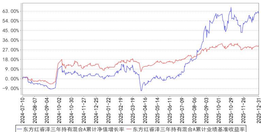
东方红睿泽三年持有混合A累计净值增长率与同期业绩比较基准收益率的历史走势对比图