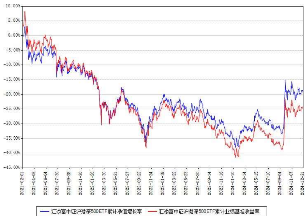
汇添富中证沪港深500ETF累计净值增长率与同期业绩基准收益率对比图