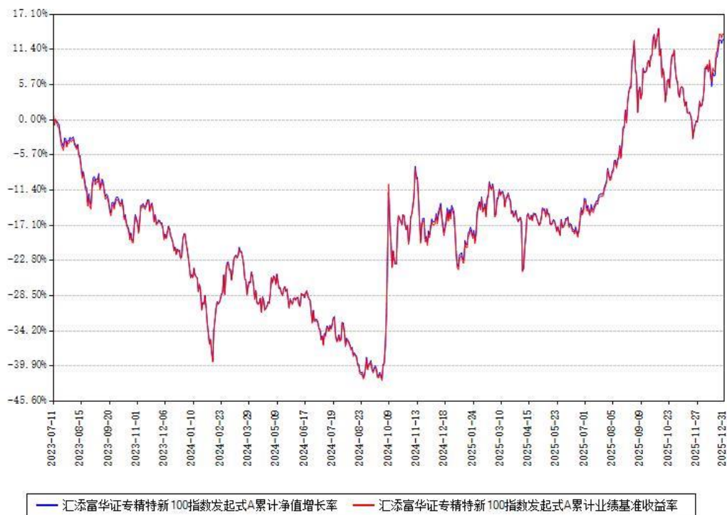
汇添富华证专精特新100指数发起式A累计净值增长率与同期业绩比较基准收益率对比图