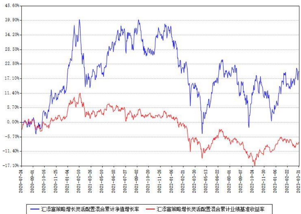
汇添富策略增长灵活配置混合累计净值增长率与同期业绩基准收益率对比图