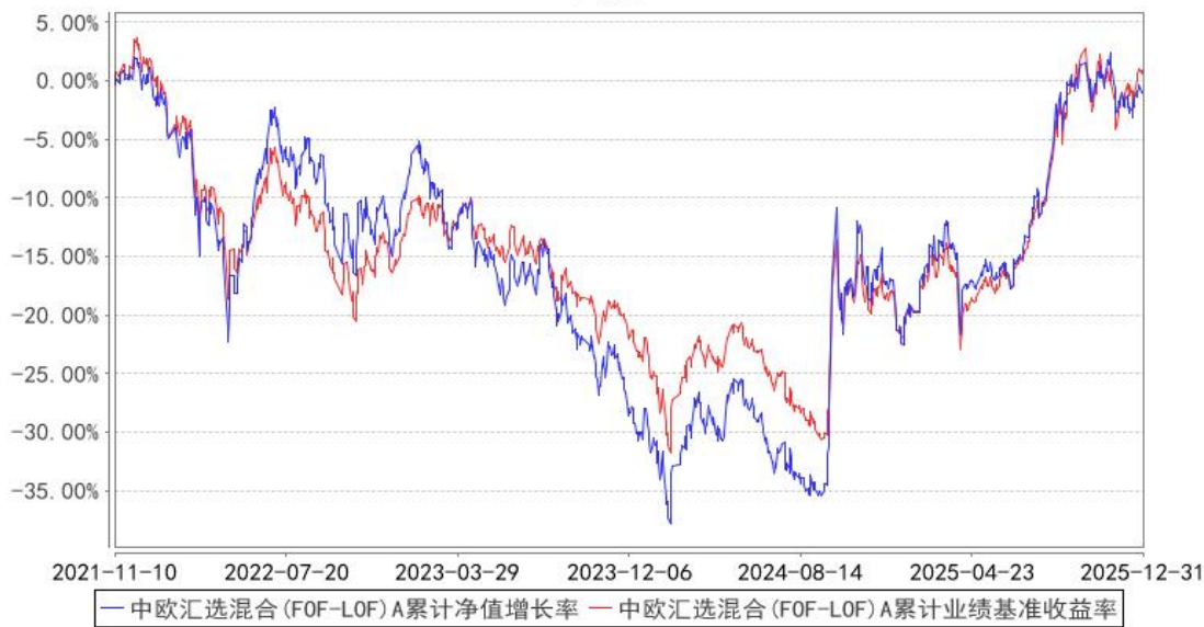
中欧汇选混合 (FOF-LOF) A 累计净值增长率与同期业绩比较基准收益率的历史走势对比图

注：2023 年 5 月 5 日起组合业绩比较基准变更为中证偏股型基金指数收益率×80%+银行活期存款利率(税后)×20%。