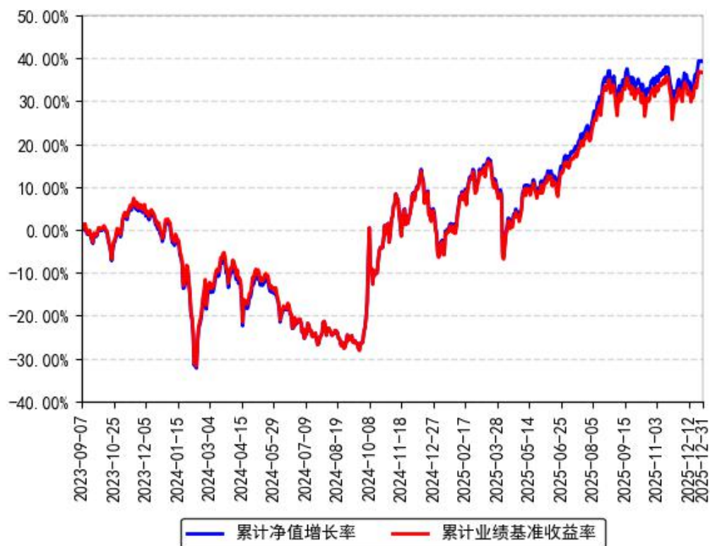
南方中证2000ETF累计净值增长率与同期业绩比较基准收益率的历史走势对比图