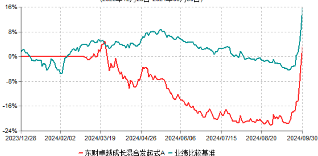
东财卓越成长混合发起式A累计净值增长率与业绩比较基准收益率历史走势对比图 (2023年12月28日-2024年09月30日)