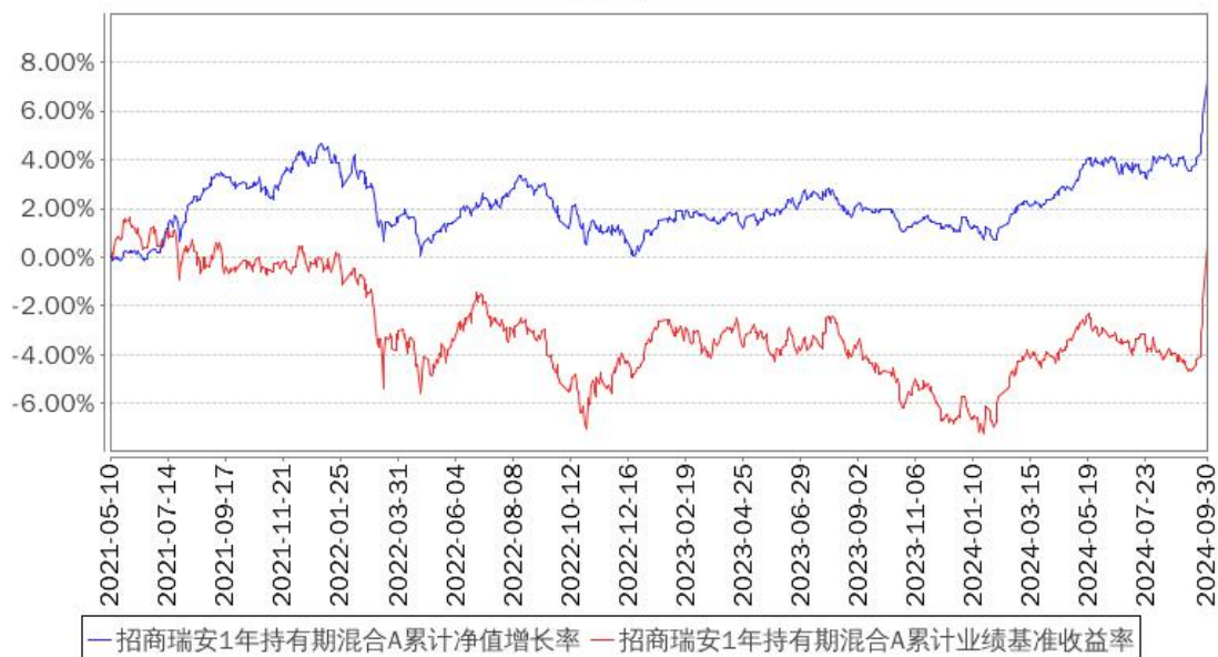
招商瑞安1年持有期混合A累计净值增长率与同期业绩比较基准收益率的历史走势对比图