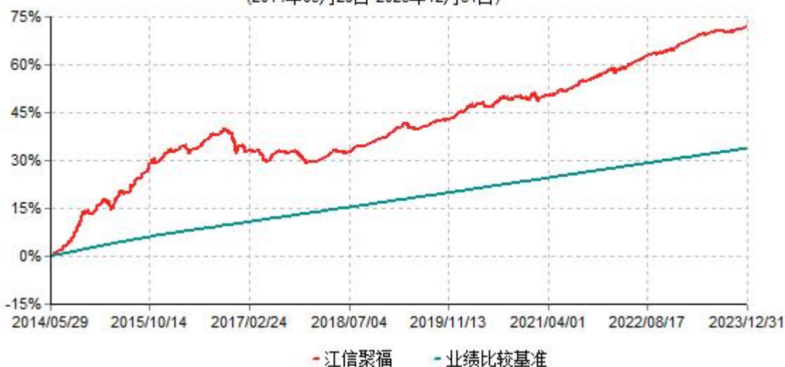
江信聚福定期开放债券型发起式证券投资基金累计净值增长率与业绩比较基准收益率历史走势对比图 (2014年05月29日-2023年12月31日)