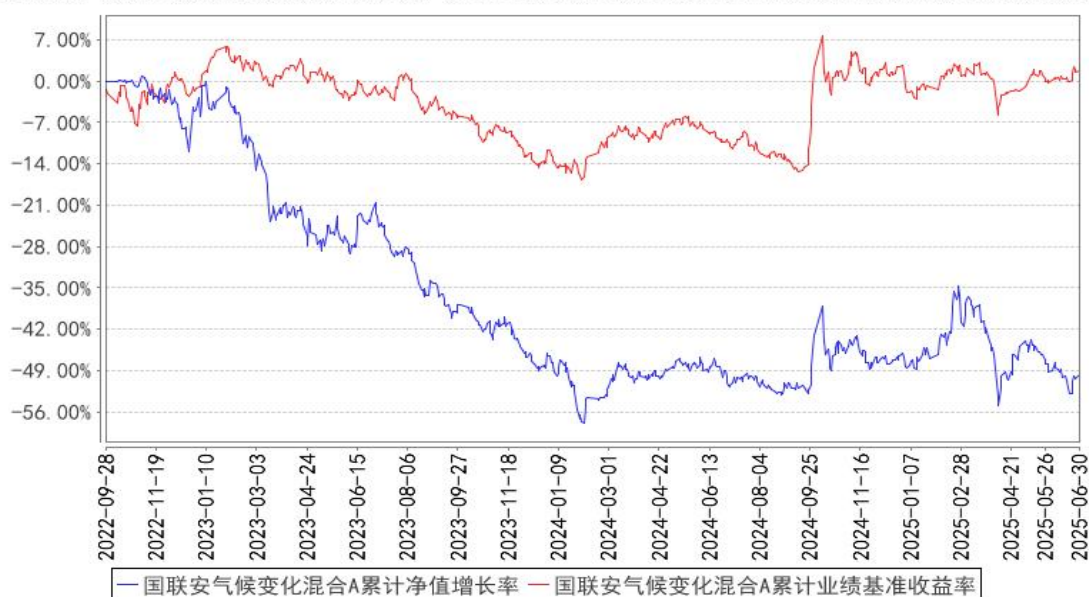
国联安气候变化混合A累计净值增长率与同期业绩比较基准收益率的历史走势对比图

注：1、国联安气候变化责任投资混合型证券投资基金于 2023 年 8 月 17 日起增加收取销售服务费的 C 类基金份额，并对本基金基金合同及托管协议作相应修改，原有的基金份额在开放申购赎回后，全部转换为国联安气候变化责任投资混合型证券投资基金 A 类份额；