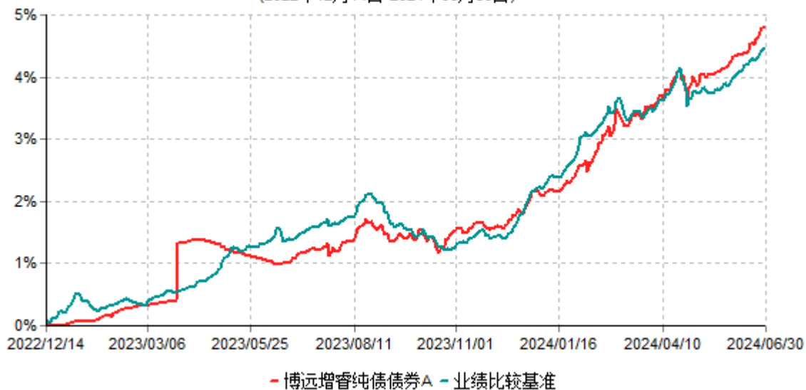
博远增睿纯债债券A累计净值增长率与业绩比较基准收益率历史走势对比图 (2022年12月14日-2024年06月30日)