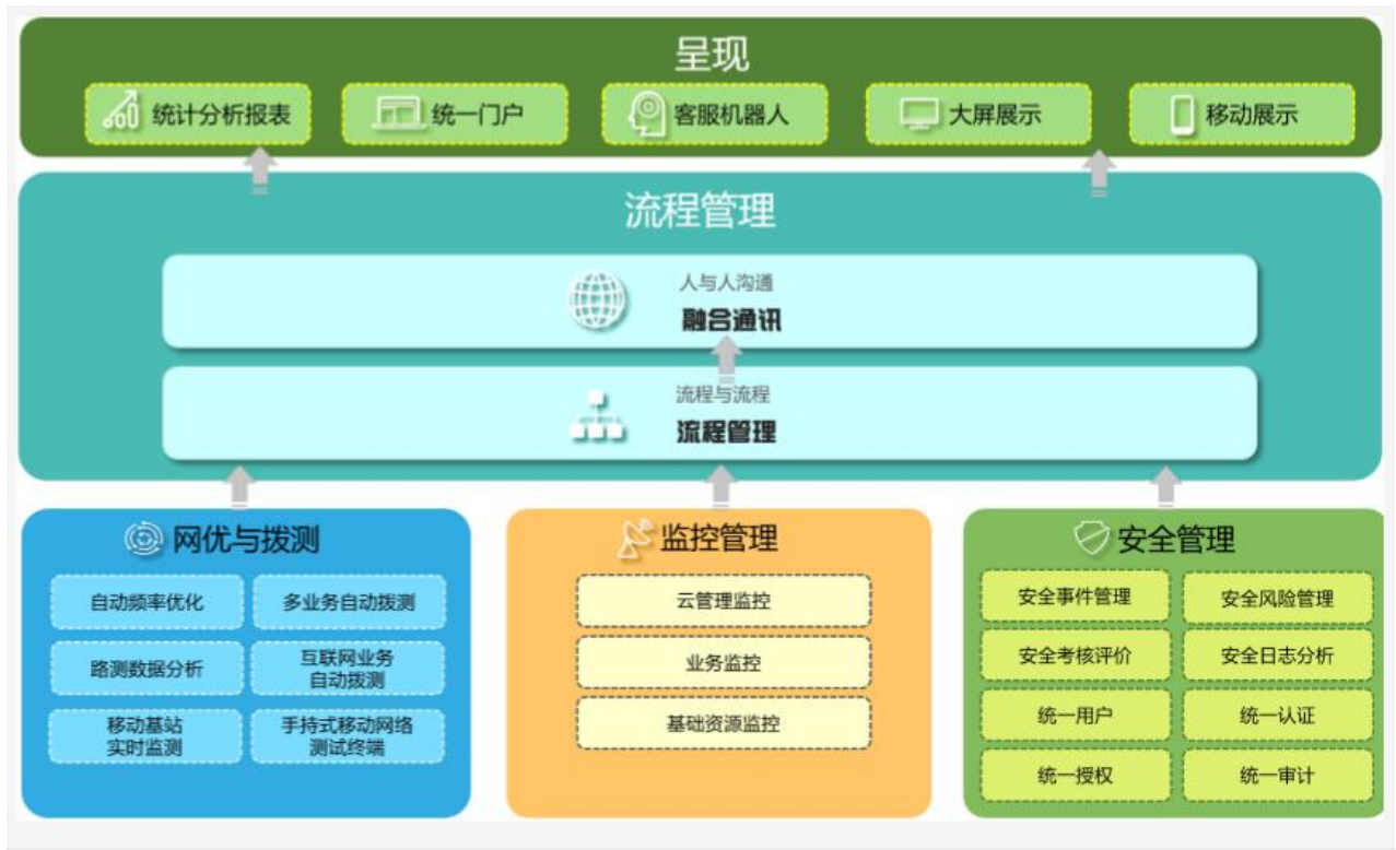
（公司ICT运营管理业务图）

公司在ICT运营管理领域一直处于国内领先水平，连续数年蝉联中国IT服务管理市场占有率榜首。公司的核心技术和产品拥有已超过1,000项的计算机软件著作权、数百项授权专利。伴随第五代移动通信技术的临近，ICT技术也将进入变革时期。在人工智能、云计算、大数据、SDN（软件定义网络）、NFV（网络虚拟化）等新架构、新技术的推动下，ICT环境正发生着颠覆性变革。同时，伴随电信运营商底层通信传输网络5G、NB-IOT的部署，电信网络的规模和复杂度不断升级，运营管理需求的空间越来越大。公司长期以来与运营商有着良好的合作，一直在跟进研究5G相关的技术及管理方式，在云化、大数据、物联网、协议解析等方案都做了相应部署准备，同时也积极跟进和参与运营商关于5G后台相应的运维标准和管理规范制定等。