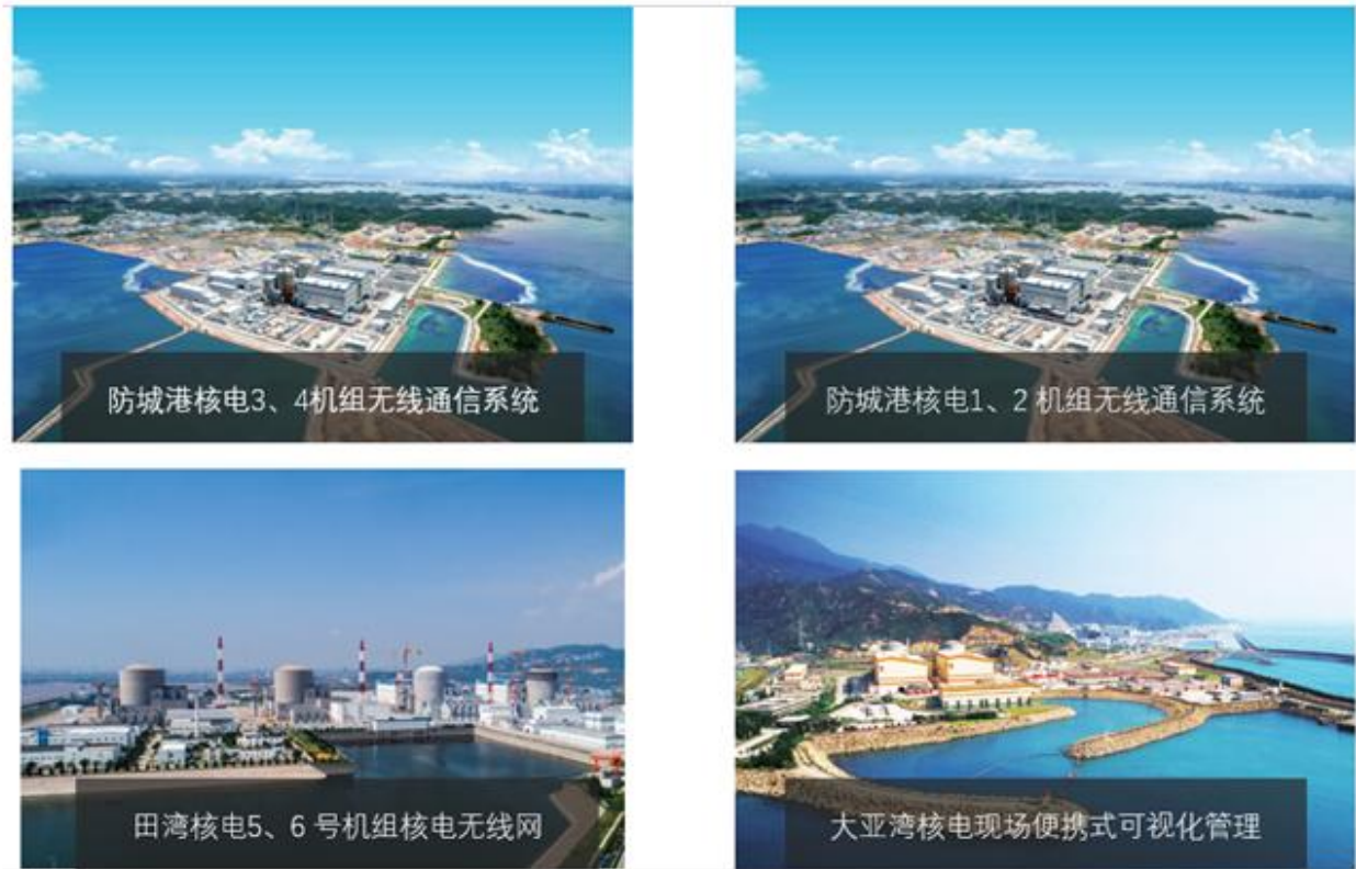
（核电通讯产品部分实施项目）

公司先后中标并成功实施中核集团田湾核电站核岛无线通信网项目、中广核集团防城港核电基地全厂覆盖的商用无线通信项目、中广核防城港核电3-4号机组无线通信系统项目、大亚湾核电生产（施工）现场便携式可视化管理项目等。同时，作为中广核“通信与物联网实验室”的重要成员，参与制定了中广核无线通信改进型WIFI技术路线的制定。中广核集团本着“标准化、专业化、集约化”的要求，统一了下属各核电站无线通信的技术路线，即：中广核下属的核电站，在进行无线通信系统新建和改造时，均采用改进型WIFI技术标准。