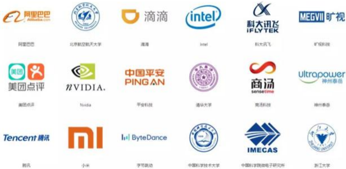
(OpenI 启智平台发起成员名单)

D、报告期内，公司继续开放泰岳历时数年所沉淀下来的NLP技术，结合AI研究院的最新研发成果，推进泰岳语义工厂和智能写作平台的对外合作。