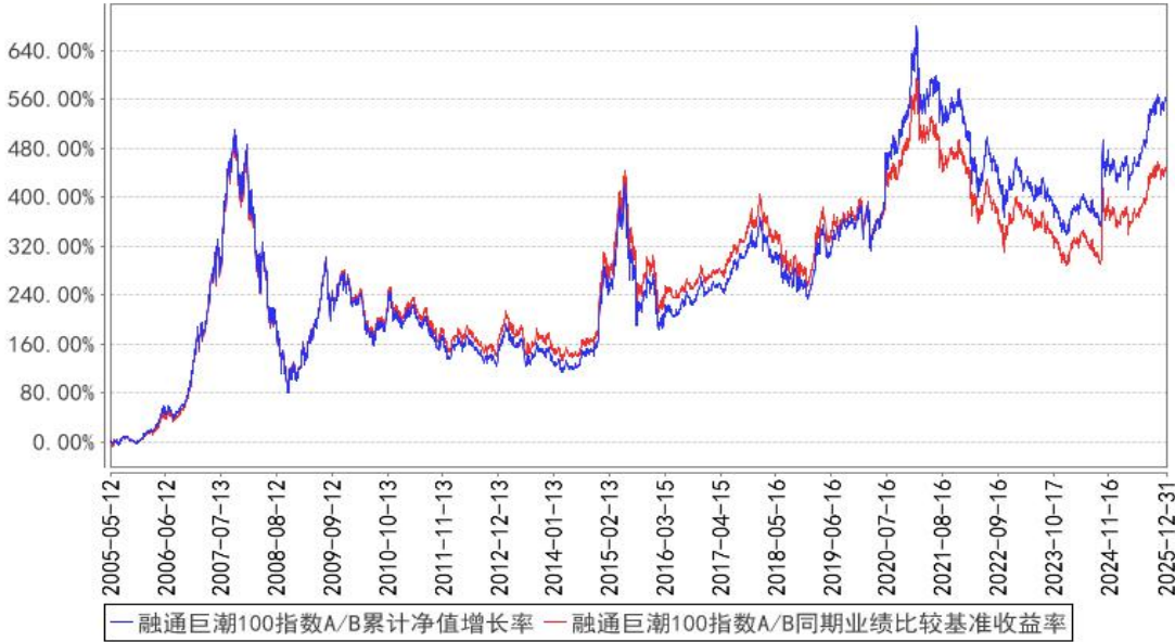
融通巨潮100指数A/B累计净值增长率与同期业绩比较基准收益率的历史走势对比图