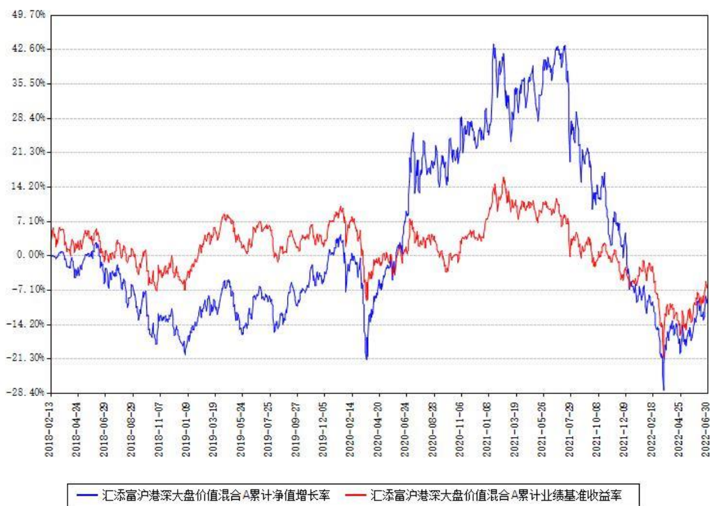
汇添富沪港深大盘价值混合A累计净值增长率与同期业绩基准收益率对比图