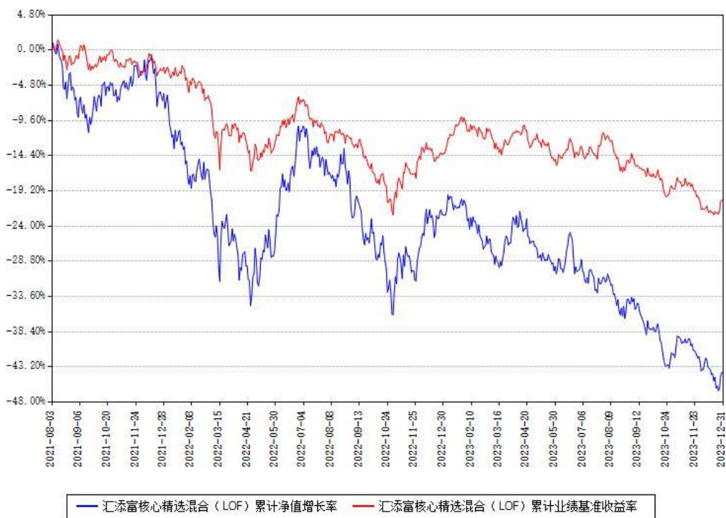
汇添富核心精选混合（LOF）累计净值增长率与同期业绩比较基准收益率对比图

注：本基金建仓期为本《基金合同》生效之日（2021年08月03日）起6个月，建仓期结束时各项资产配置比例符合合同约定。