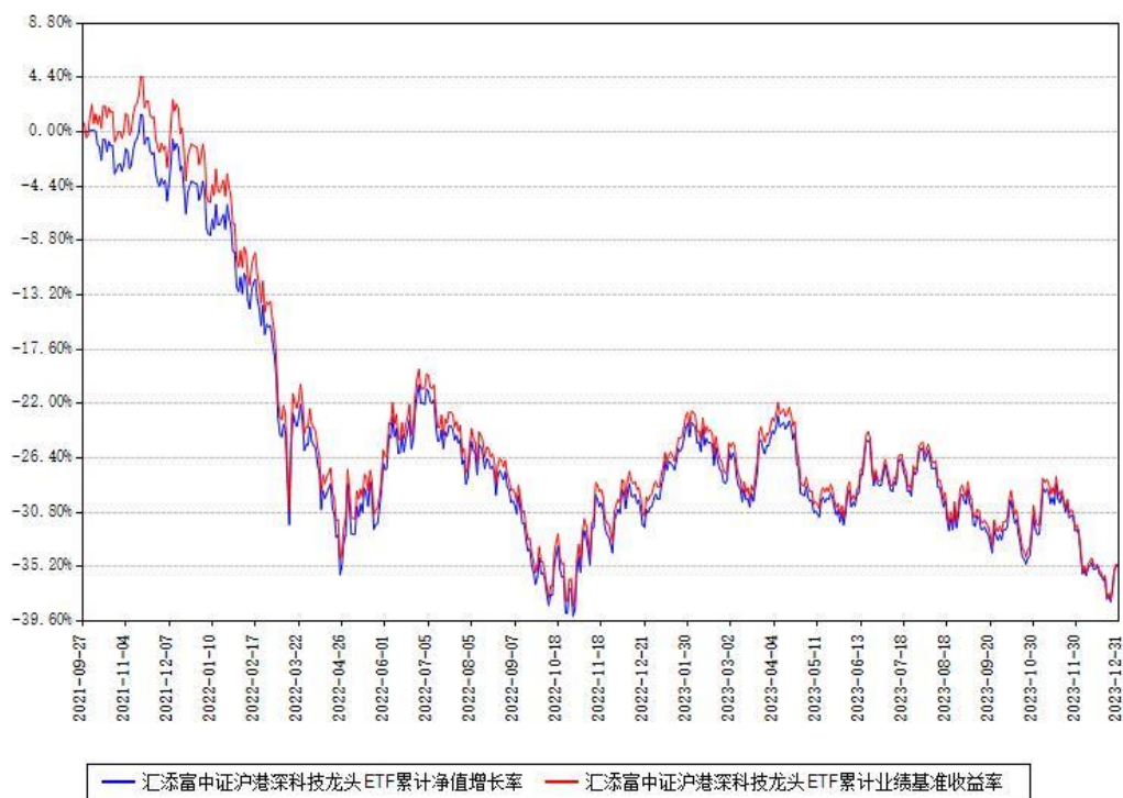
汇添富中证沪港深科技龙头ETF累计净值增长率与同期业绩基准收益率对比图

注：本基金建仓期为本《基金合同》生效之日（2021年09月27日）起6个月，建仓期结束时各项资产配置比例符合合同约定。