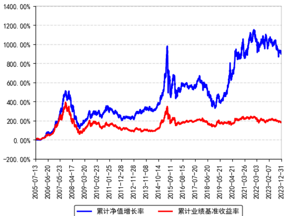
南方高增长混合（LOF）累计净值增长率与同期业绩比较基准收益率的历史走势对比图