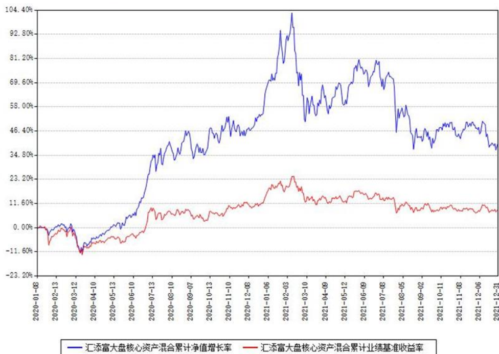
汇添富大盘核心资产混合累计净值增长率与同期业绩基准收益率对比图

(二) 自基金合同生效以来基金累计净值增长率变动及其与同期业绩比较基准收益率变动的比较图