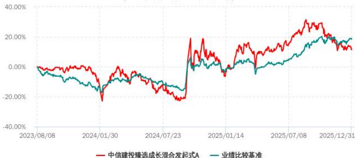
中信建投臻选成长混合发起式A累计净值增长率与业绩比较基准收益率历史走势对比图 (2023年08月08日-2025年12月31日)