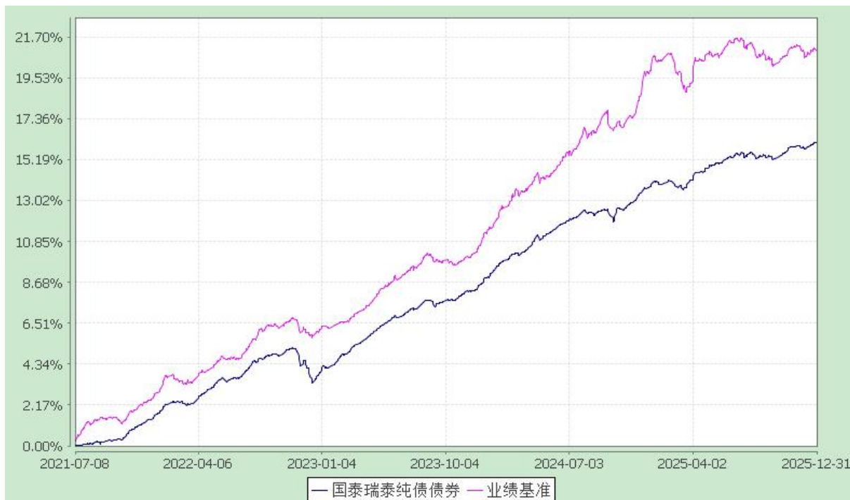
自基金合同生效以来份额累计净值增长率与业绩比较基准收益率的历史走势对比图 (2021 年 7 月 8 日至 2025 年 12 月 31 日)

注：本基金合同生效日为 2021 年 7 月 8 日，本基金在六个月建仓期结束时，各项资产配置比例符合合同约定。