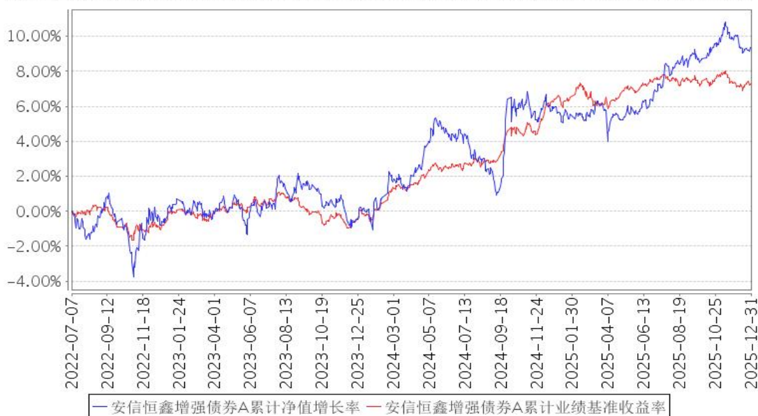
安信恒鑫增强债券A累计净值增长率与同期业绩比较基准收益率的历史走势对比图