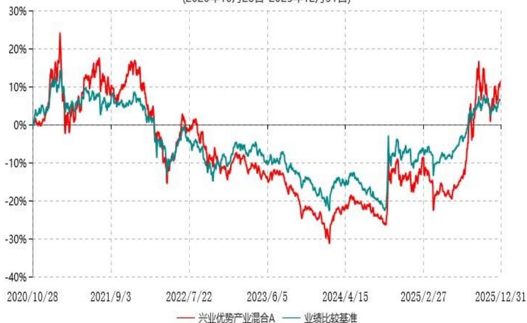
兴业优势产业混合C累计净值增长率与业绩比较基准收益率历史走势对比图