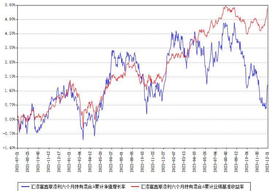
汇添富鑫享添利六个月持有混合A累计净值增长率与同期业绩基准收益率对比图