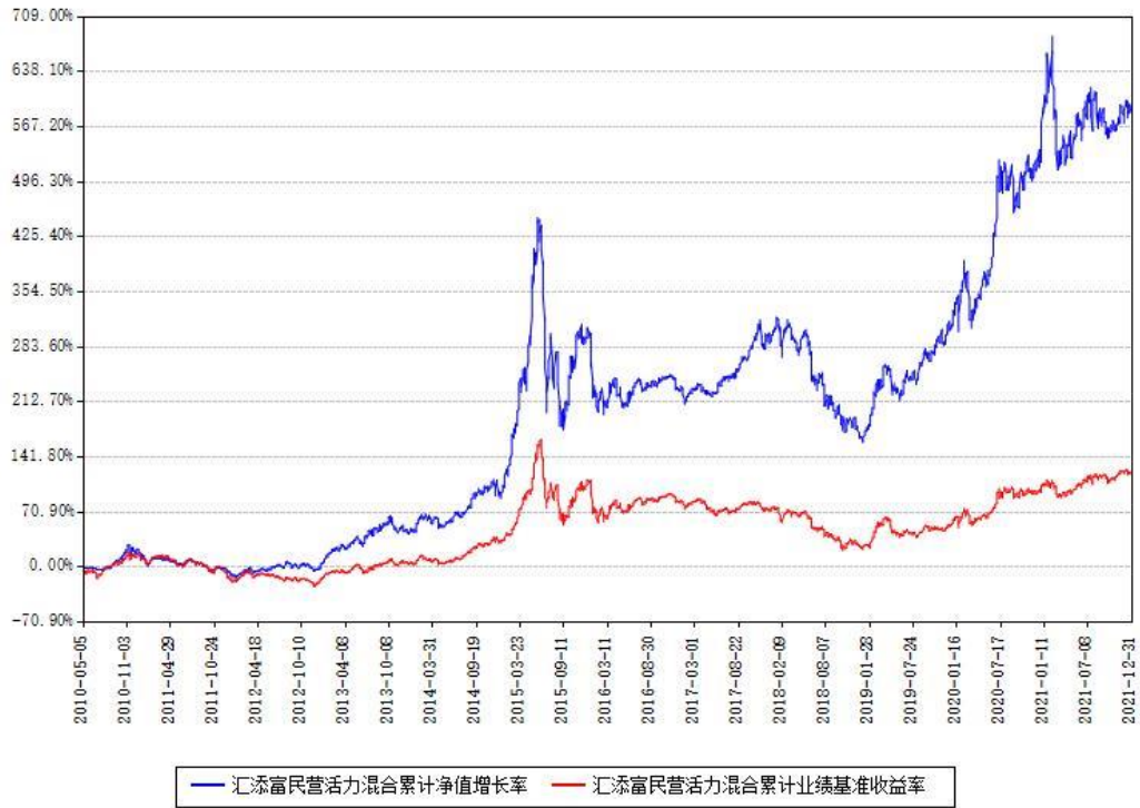
汇添富民营活力混合累计净值增长率与同期业绩基准收益率对比图