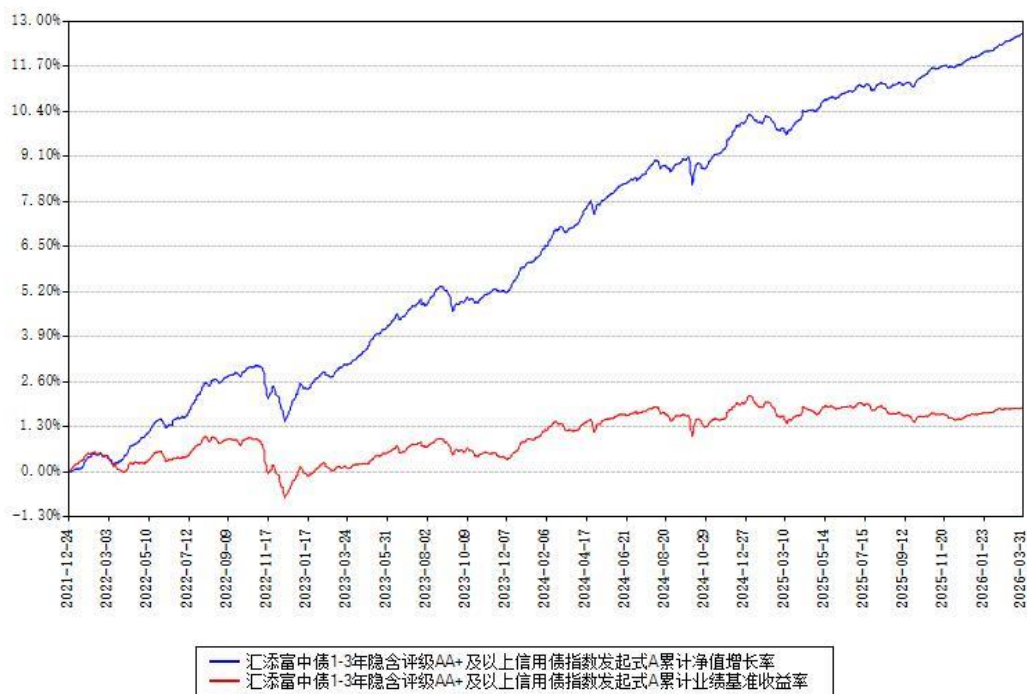
汇添富中债1-3年隐含评级AA+及以上信用债指数发起式A累计净值增长率与同期业绩比较基准收益率对比图