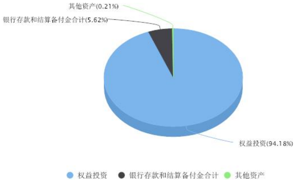
投资组合资产配置图表 数据截止日期:2023年09月30日