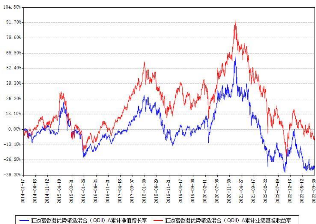
汇添富香港优势精选混合(QDII)A累计净值增长率与同期业绩基准收益率对比图